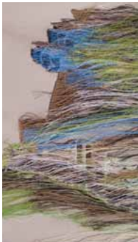
矢代仁しか製作することのできなくなった縫取御召の裏にはこんなに沢山の糸が通っています。